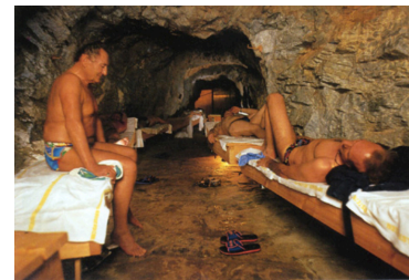
バドガシュタイン洞窟療法

バドガシュタインは、世界中から多くの人が難病治療に訪れるオーストリアの有名温泉保養地です。効果の秘密はバドガシュタイン鉱石にあります。この天然鉱石は低線量のラジウムを放出する世界最高峰のラジウム鉱石です。